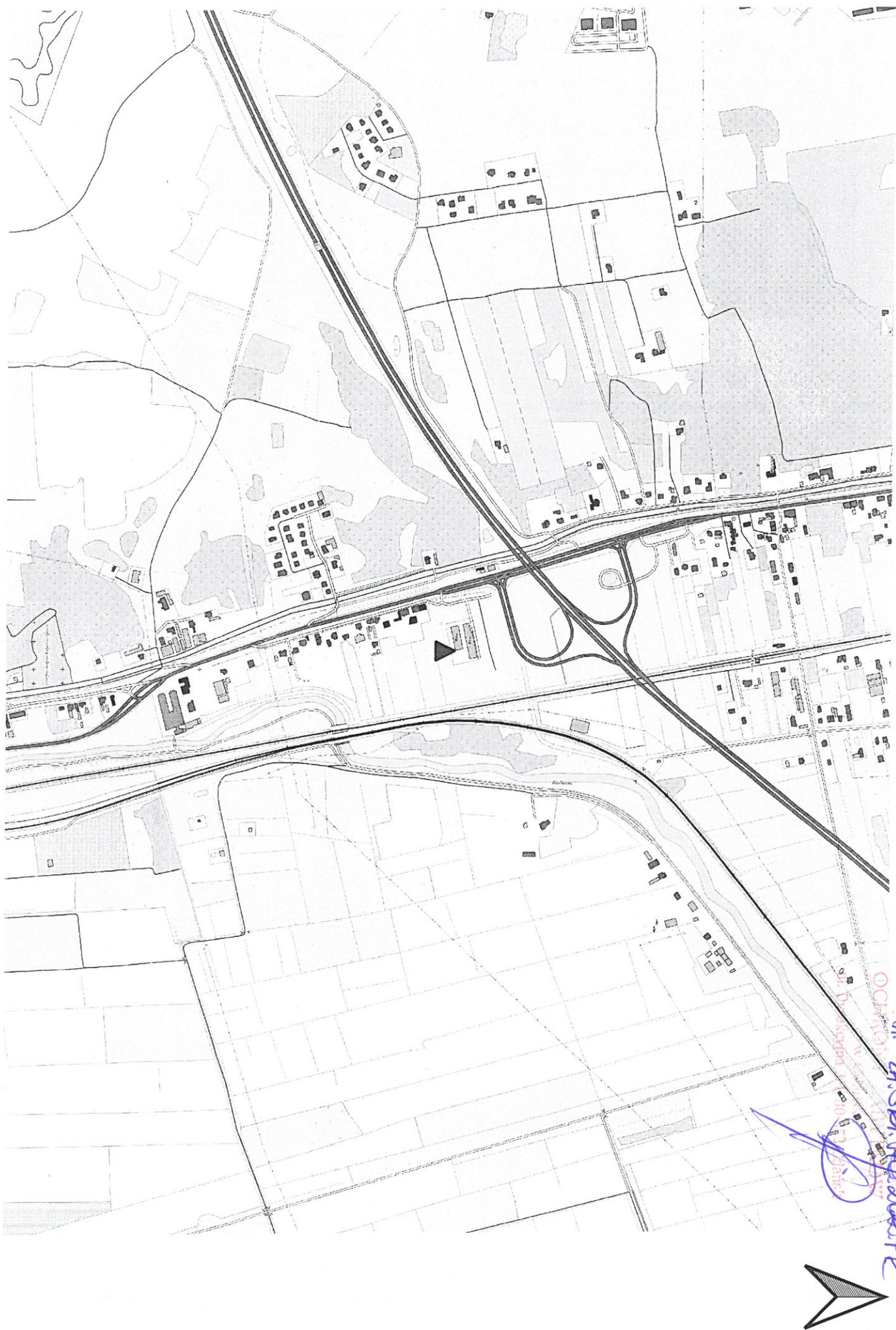
▲ Lokalizacja badań archeologicznych